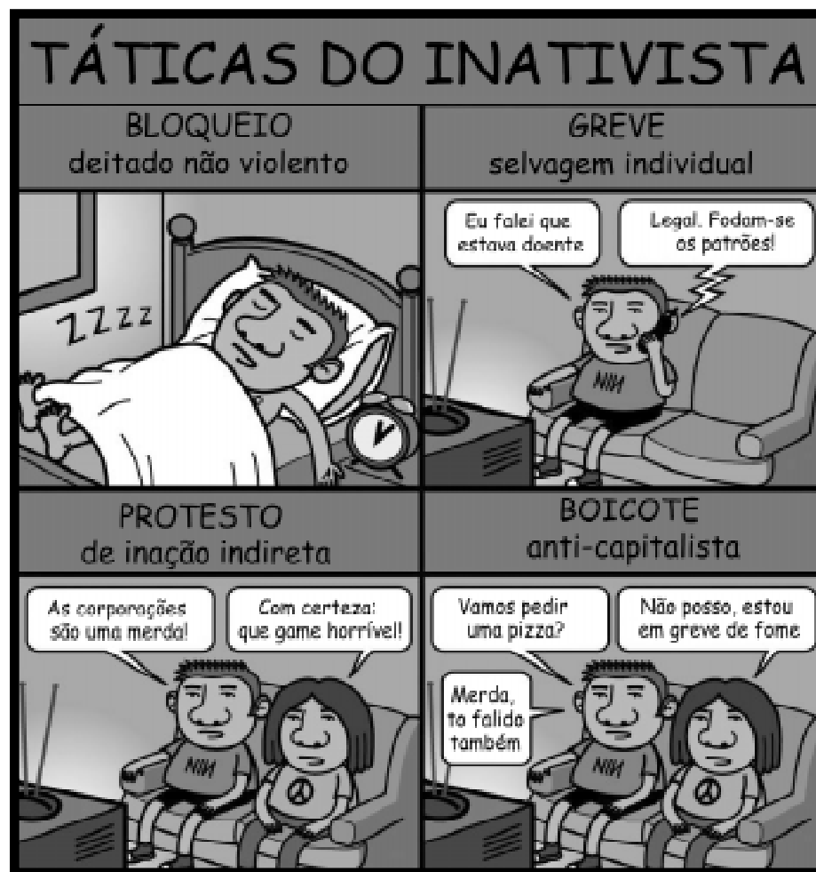
ilustração: Darrin Drda

O caso Ethyl mostra que esse dispositivo permite que empresas não apenas consigam indenizações dos governos por qualquer legislação que comprometa seus lucros, mas ainda que, por medo dos prejuízos, a legislação seja retirada, às vezes mesmo no estágio inicial de discussão (essa era a intenção quando a Ethyl fez a primeira ameaça de processo). Além disso, o mecanismo de processo de empresas contra governos é marcado pela total falta de transparência, numa afronta ao direito democrático de controle e escrutínio. Os processos de empresas contra estados, que freqüentemente têm como disputa políticas públicas, acontecem em tribunais que podemos caracterizar como privados. São tribunais especiais, fechados, compostos por três juízes apontados pelas partes que decidem sem o auxílio de jurados. No NAFTA, os tribunais designados para a resolução das disputas entre estados e empresas são tribunais do Banco Mundial e das Nações Unidas. O mecanismo que permite o processo de empresas contra estados sob o NAFTA deve ser incorporado integralmente na ALCA, sem variações significativas, se a vontade dos negociadores prevalecer. Na versão preliminar do acordo, liberada em setembro de 2001, todas as propostas (ou seja, todas as versões do capítulo propostas pelos diferentes países) incluem mecanismos de processo de empresas contra estados e contêm uma definição de expropriação suficientemente ampla a ponto de conter perdas de lucro advindas da introdução de legislação social e ambiental.