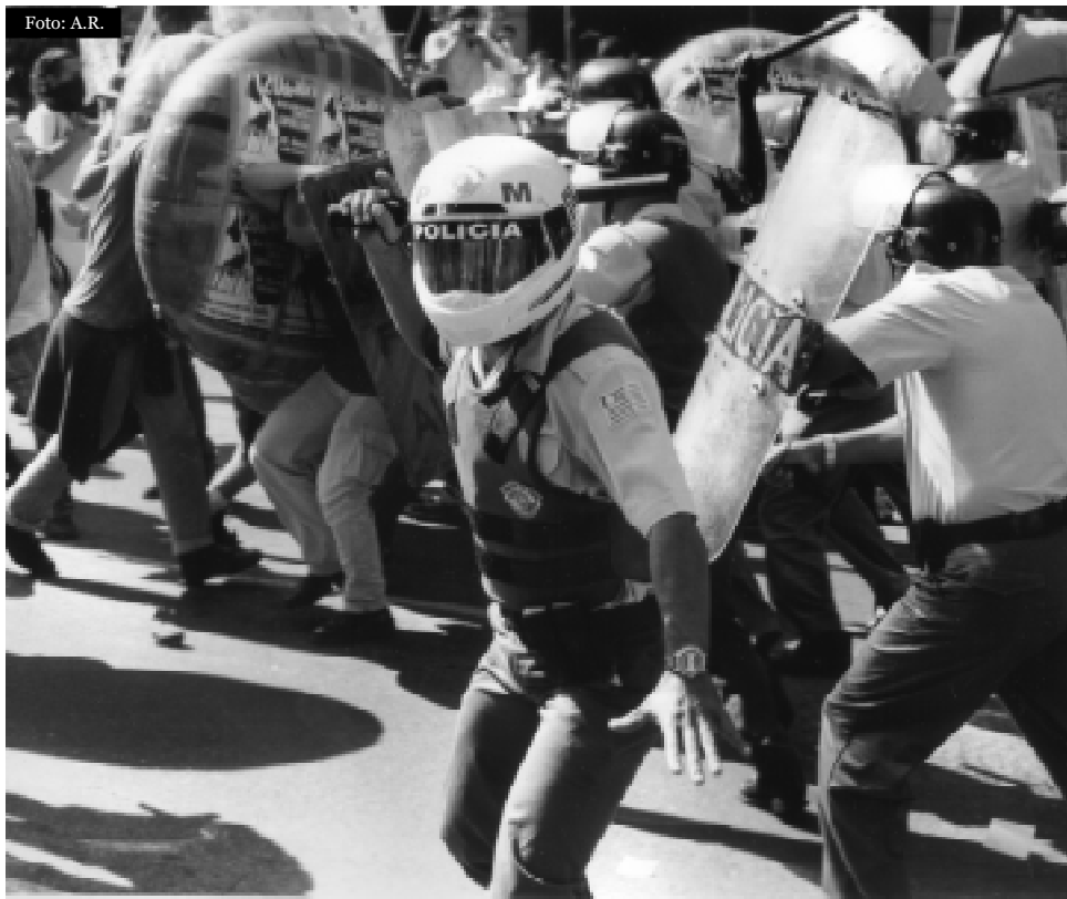
São Paulo, 20 de abril de 2001: os defensores da ALCA apresentam seus argumentos

ALCA é a sigla para Área de Livre Comércio das Américas, um acordo que visa constituir um bloco comercial com livre circulação de bens, serviços e capitais em todo o continente americano (com a exceção de Cuba). A ALCA começou a ser discutida em 1994 por iniciativa dos Estados Unidos que queriam ampliar a experiência do NAFTA (Acordo de Livre Comércio da América do Norte) para todo o continente.