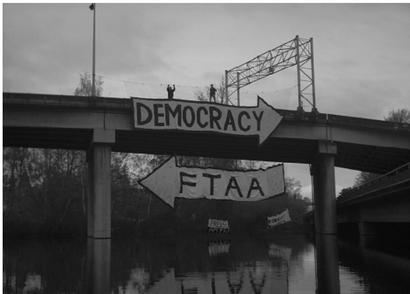
Quebec, 20 de abril de 2001: a ALCA (em inglês FTAA) na contramão da democracia

Esse é um dos motivos pelos quais grupos radicais tentam impedir as reuniões de negociação, que são cercadas por um forte esquema de segurança. Em Québec, em abril de 2001, foram gastos 25 milhões de dólares em segurança para conter os manifestantes que exigiam o fim da reunião secreta. No mesmo esquema das reuniões da OMC, Banco Mundial e FMI, as rodadas da ALCA são cada vez mais eventos que acontecem sob a tensão que opõe representantes do poder dos ricos e pessoas comuns, impulsionando o ódio daqueles que estão cansados de não poder regular a própria vida.