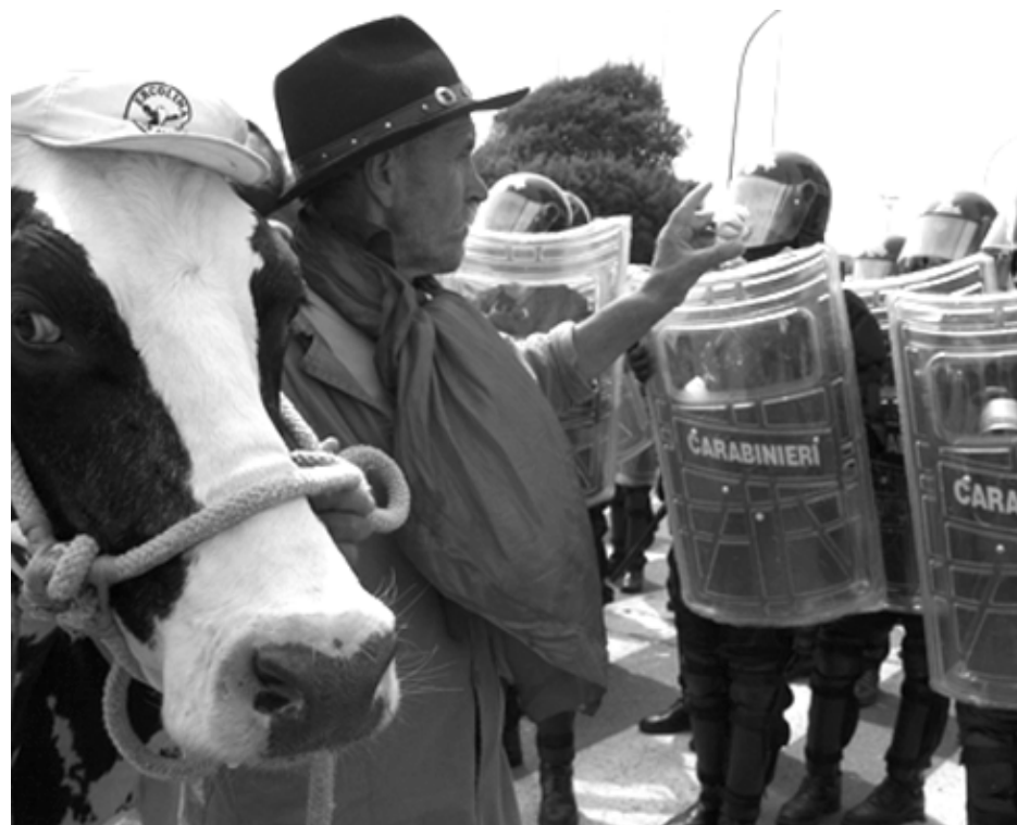
Agricultor em protesto em Gênova durante o encontro do G8

acordo, tomam medidas protecionistas como a Farm Bill, lei que elevou os subsídios à agricultura e prejudica diretamente pequenos e médios produtores rurais. Antes mesmo da Farm Bill o Brasil já havia deixado de exportar cerca de US$ 1,2 bilhão em soja devido às medidas protecionistas norte-americanas. Essas mesmas medidas, oferecidas em forma de subsídio, fazem com que os produtos agrícolas norte-americanos entrem em outros países com grande potencial produtivo nessa área, como o México. Devido à falta de barreiras, o produto é comercializado com um preço muito aquém dos apresentados pelos mexicanos. Dessa forma, o livre comércio entre países com uma economia forte (que podem conceder subsídios aos agricultores) e países com uma economia fraca (que não conseguem arcar com essa responsabilidade mesmo tendo grande potencial) também causa milhares de perdas de empregos de pequenos produtores e um grande êxodo rural causado pela perda desses empregos.